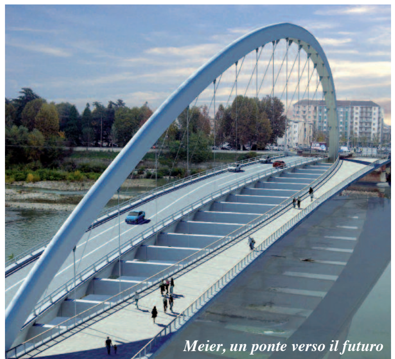
Meier, un ponte verso il futuro