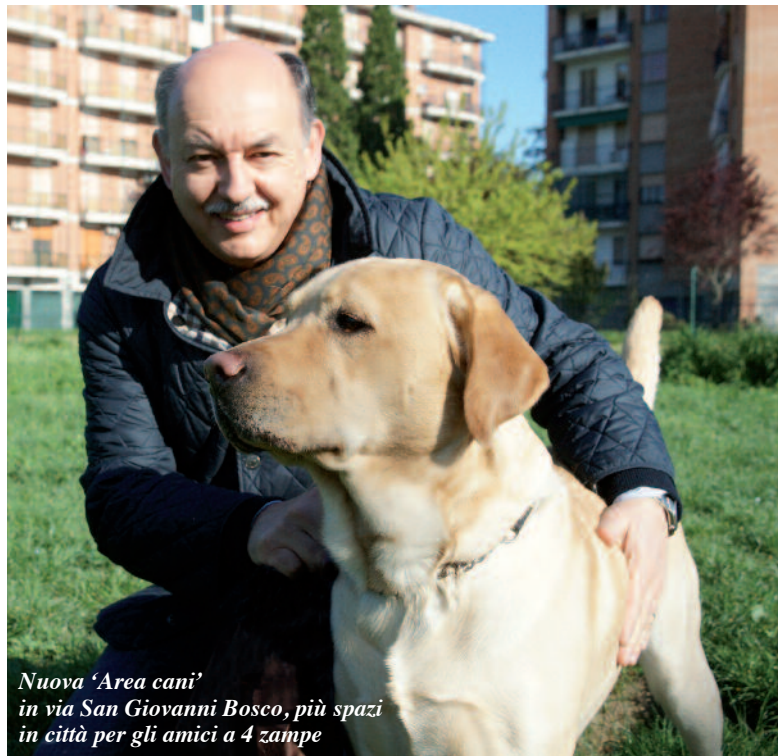
Nuova 'Area cani' in via San Giovanni Bosco, più spazi in città per gli amici a 4 zampe